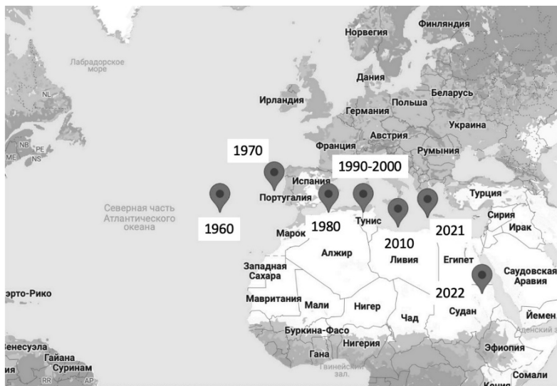
Рисунок 3. Смещение географического местоположения центра экономической гравитации с 1960 по 2022 гг. 12

Как наглядно видно на рисунке, географическое местоположение центра экономической гравитации по ВВП существенно сдвинулось не только на Восток, но и на Юг, что свидетельствует о росте удельного веса стран, прежде всего расположенных в Азии. По прогнозам, данная траектория смещения центра экономической гравитации сохранится еще долгое время. Важным условием для этого станет дальнейшее увеличение к 2040 году удельного веса ВВП стран Азии в глобальном ВВП до 50%, а совокупного потребления в странах Азии — до 40% от мирового уровня 13 . Другой фактор — рост включенности стран Азии в международную торговлю, а также, что крайне важно, рост внутрирегиональных товарных и инвестиционных потоков в этом регионе.