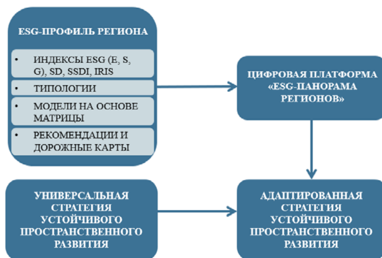
Рисунок 3. Инструменты для создания стратегии устойчивого пространственного развития, адаптированной под специфику региона 3

Универсальная стратегия устойчивого пространственного развития представляет собой формализованный структурный шаблон, в рамках которого обеспечивается сопряжение аналитической диагностики, типологического позиционирования и проектной реализации. Ее универсальность обеспечивает воспроизводимость подхода, а цифровая конфигурация — адаптивность содержания в зависимости от конкретной модели развития региона (Рисунок 3).