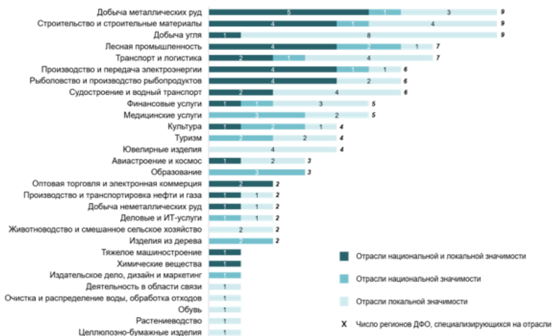
Рисунок 3. Распределение отраслей специализации Дальнего Востока по типам значимости 16

Средний уровень развития отраслей специализации дальневосточных регионов (Таблица 3) невысокий — 2,4 балла (при возможном максимуме в 5 баллов). Из 29 специализаций 8 имеют средний балл выше уровня по ДФО, на них приходится 10% работников экономики макрорегиона. На специализации с более низким уровнем развития — 24,5% работников.