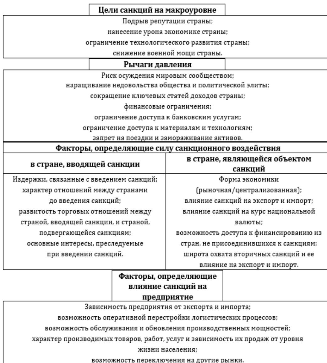
Рисунок 1. Причинно-следственные связи экономических санкций 5

Резюмирует вышесказанное модель, характеризующая причинно-следственные связи экономических санкций (Рисунок 1).