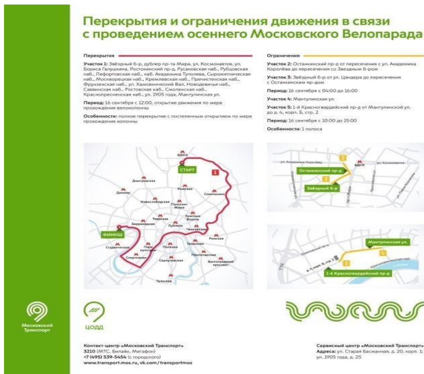
Рисунок 1. Маршрут осеннего Московского Велопарада и схема перекрытий/ограничений движения 1